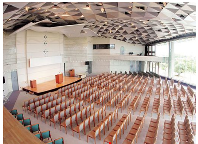
コンベンションセンターメインホール