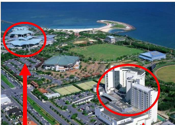
コンベンションセンター

懇親会は会場隣接のラグナガーデン・ホテルにて、琉球舞踊による幕開け、エイサー踊り、地元の歌手によるミニライブを企画しています。学会後の癒しに是非、盛り上げて行きたいと思っています。